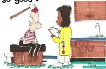
"Can you describe your symptoms."